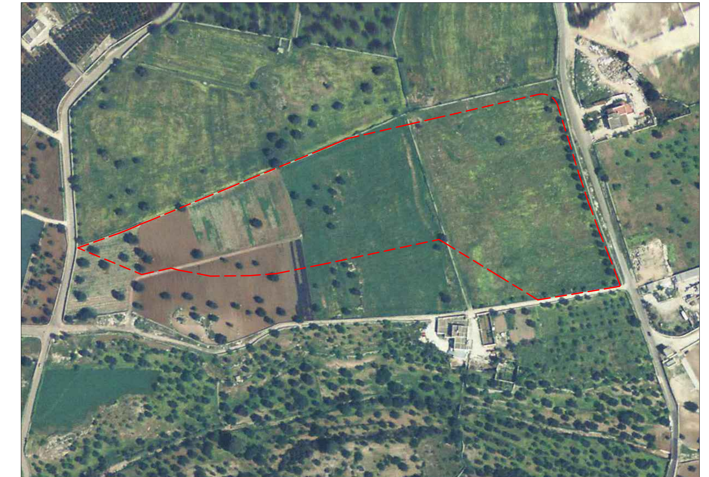
----- Perimetro PUE A11 rapp. 1:2000