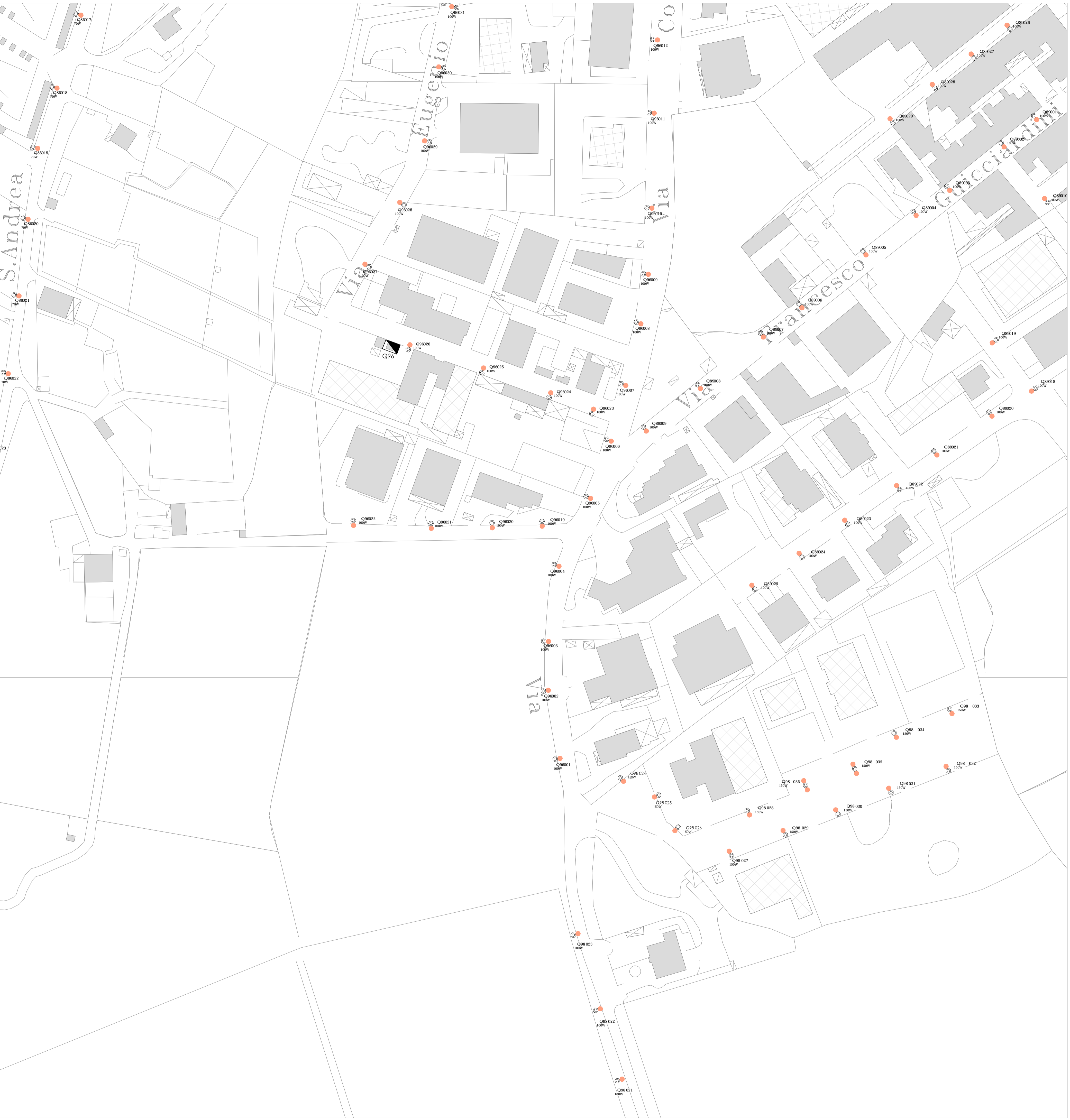
CENTRO ABITATO E CONTRADE